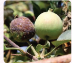
โรคผิวไหม้ในผลไม้