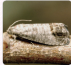
ผีเสื้อหนอนเจาะกลางคืน