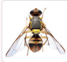
แมลงวันผลไม้