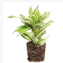
พืชที่มีดินติด