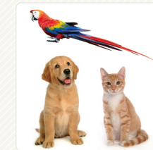
สัตว์เลี้ยง

❖ กรณีที่สัตว์และผลผลิตจากการทำปศุสัตว์จำนวนมากไม่ได้ ใบรับรองการกักกันโรค ที่ออกโดยหน่วยงานรัฐบาลของประเทศผู้ส่งออก จะไม่สามารถนำเข้ามาในเกาหลีได้ ❖ กรณีที่พกพาสัตว์หรือผลิตภัณฑ์อาหารจากการทำปศุสัตว์เข้ามาในประเทศ กรุณาแจ้งต่อสำนักงานกักกันโรคภาคเกษตรกรรมและปศุสัตว์ เพื่อตรวจสอบว่า สามารถนำเข้ามาได้หรือไม่