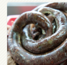
ไส้กรอกเลียด