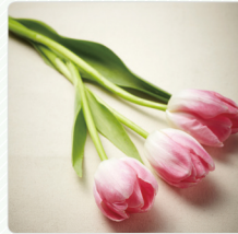
ดอกไม้ (ไม้ตัดดอก)