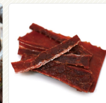
เนื้อตากแห้ง