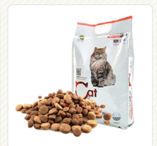
อาหารสัตว์