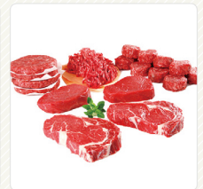
ผลิตภัณฑ์จากเนื้อสัตว์