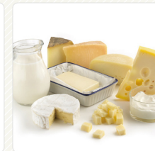
ผลิตภัณฑ์จากนม