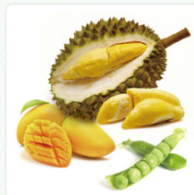
ผลไม้สด, ผักประเภทกินผล